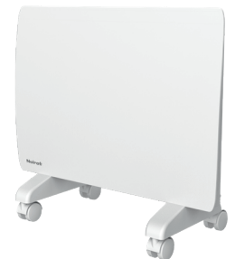
Jeu de roulettes pour utilisation mobile (en option)